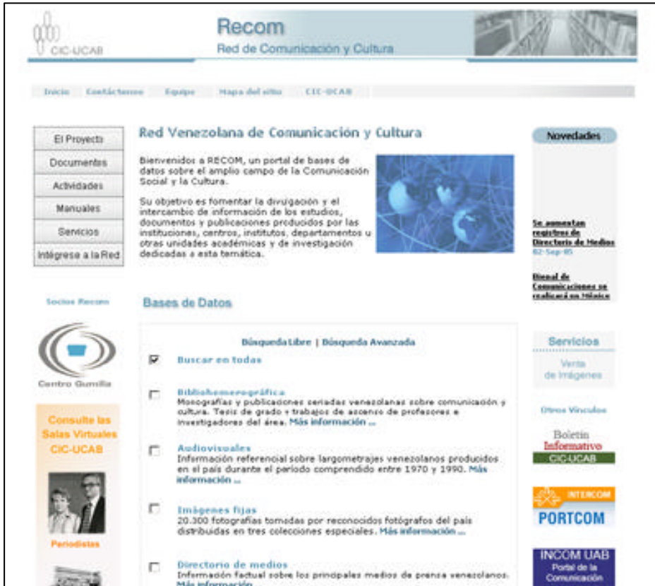
Gráfico 1: Portal de acceso a Recom

Por el otro lado, destacan las Salas Virtuales de Investigación (SVI) que presentan colecciones particulares en texto completo, de personalidades relevantes de la comunicación y la cultura del país. Estas salas también ofrecen contenidos de producción propia, que agregan valor a las colecciones personales en formato digital.