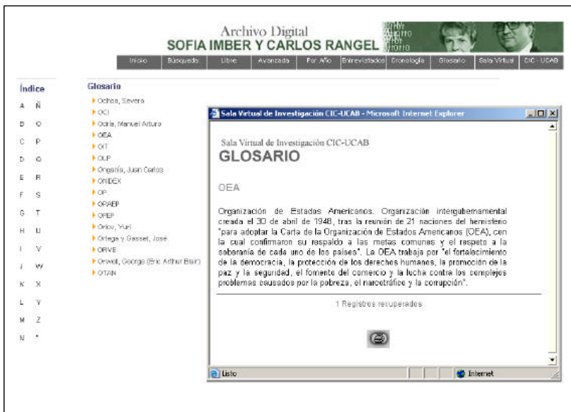
Gráfico 3: Ejemplo de consulta de Glosario en el Archivo Digital de las SVI

Los documentos secundarios, por su parte, son elaborados por miembros del equipo de trabajo y permiten contextualizar la obra periodística. Entre estos últimos figuran la cronología de los hechos ocurridos durante la vida del periodista, los textos biográficos, las investigaciones realizadas sobre algún aspecto de su vida y obra, los glosarios de términos y diccionarios biográficos de personas e instituciones relacionadas.